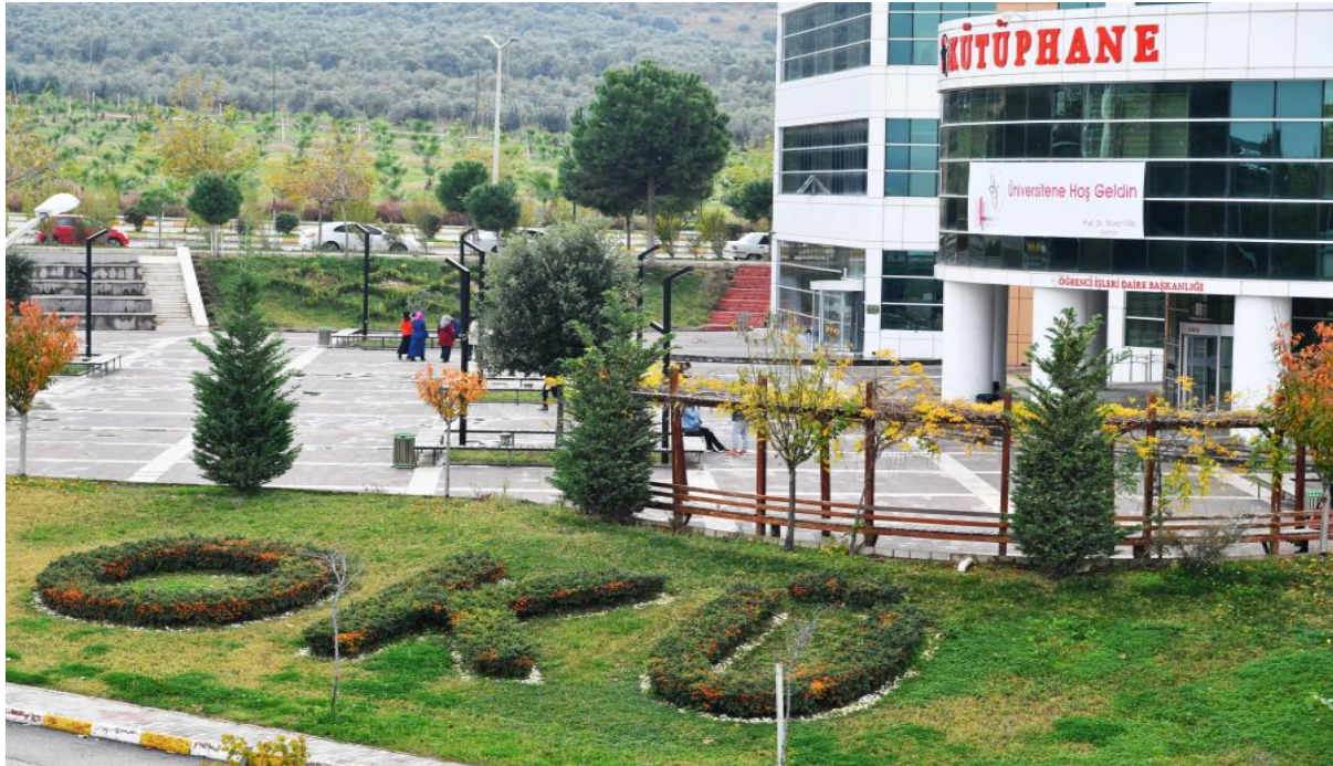
Resim 5: OKÜ Kütüphane