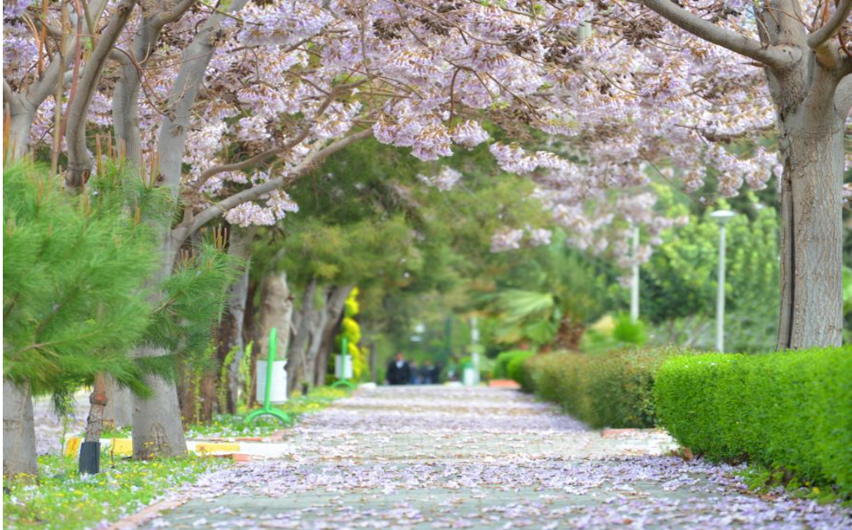
Resim 3: OKÜ Karacaoğlan Yerleşke Alanı İlkbahar