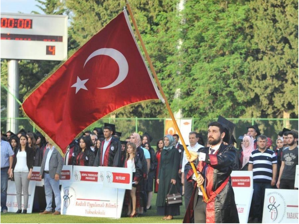
Resim 6: OKÜ Mezuniyet

8- Öğrencilerin ve halkın kullanımına yönelik içerisinde sauna ve buhar hamamı bulunan 1 yarı olimpik yüzme havuzu, halı saha, 2 tenis kortu, FİFA standartlarına uygun çim saha, fitness salonu, 2 squash salonu, çeşitli spor alanları, önlisans, lisans ve lisansüstüne yönelik laboratuvarlar donanımlı çalışma alanları aktif olarak hizmet vermektedir.