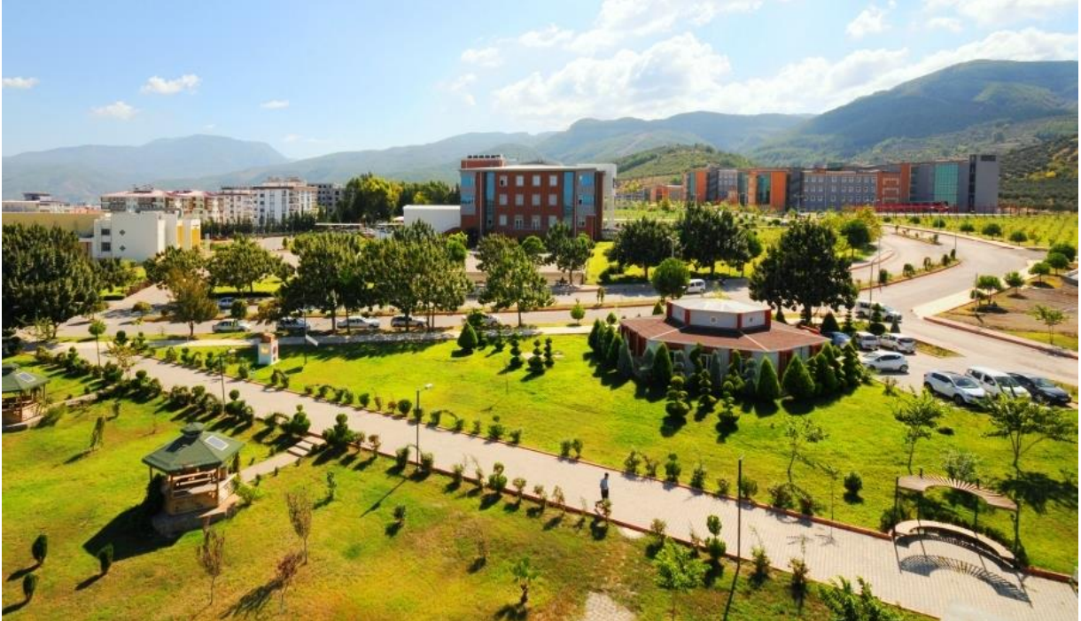
Resim 1: OKÜ Karacaoglan Yerleşkesi

Yükseköğretim kurumları olarak amacımız; yüksek düzeyde bilimsel çalışma ve araştırma yapmak, bilgi ve teknolojiyi üretmek, bilim verilerini yaymak, ulusal alanda gelişme ve kalkınmaya destek olmak, yurtiçi ve yurtdışı kurumlarla işbirliği yapmak suretiyle bilim dünyasının seçkin bir üyesi haline gelmek, evrensel ve çağdaş gelişmeye katkıda bulunmaktır.