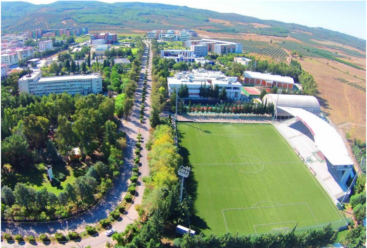
Resim 2: OKÜ Karacaoğlan Yerleşkesi

Osmaniye Korkut Ata Üniversitesinin 2023 yılı itibariyle sahip olduğu fiziki kapalı alanlar hakkındaki bilgi Tablo 1'de detaylı bir şekilde verilmiştir.